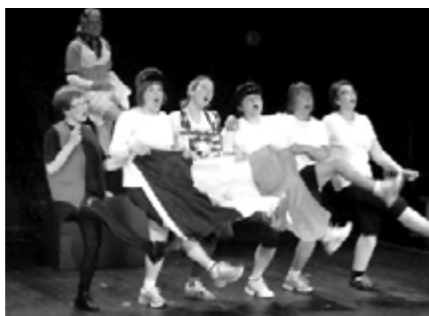
Les Exclamateurs fleurysois, dans un Ubu sportif et hilarant.