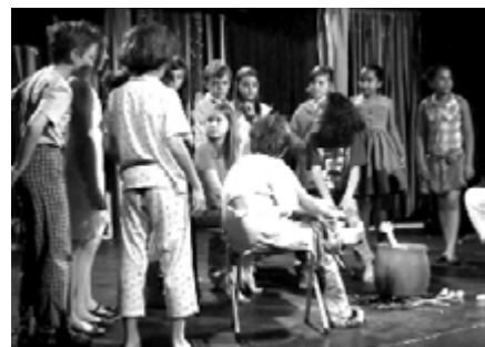
Les 16 plus petits dans la fable espagnole La soupe aux cailloux .