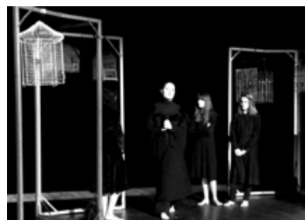
Les adolescentes du Pays de Rien , de Nathalie Papin.