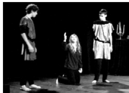
Le second groupe d'ados a osé s'attaquer à l'imposant Macbeth .