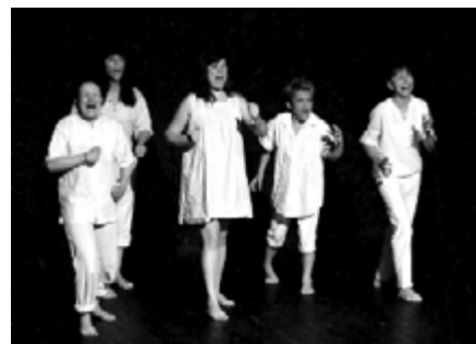
Les adultes de Beaugency, tout en sensibilité dans des pièces de Carole Fréchette.