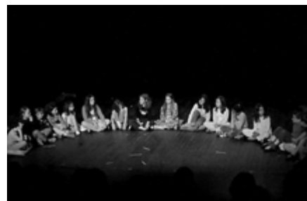
Exclamateurs Primaires : Bouh!

Retour en images sur les représentations des ateliers amateurs fin juin, Jours Fous et Fantaisies Cyclopédiques.