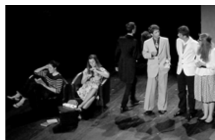
Exclamateurs Lycéens : Les Bâtisseurs d'Empire, ou le Schmürz de Boris Vian.