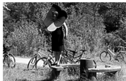
Exclamateurs Adultes Fleury-les-Aubrais : Fantaisies Cyclopédiques