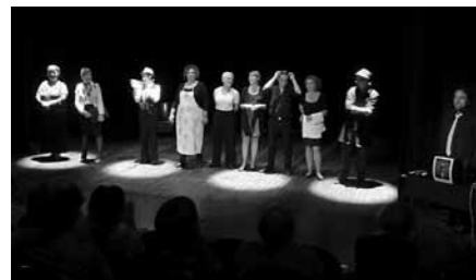
Improvisateurs : Impro-Polar.