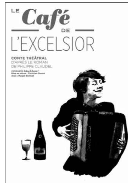
LE CAFÉ DE L'EXCELSIOR Création de la compagnie les jours de bassan ! (région Centre - Val de Loire)

Vendredi 25 septembre, à partir de 18h Oberva-Loire, parc Thérél