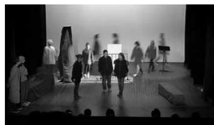
Exclamateurs Adolescents : Histoire aux cheveux rouges de Maurice Yendt.