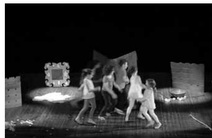
Exclamateurs Enfants : Les peuples de l'horloge de Chantal Dailly.

Retour en images sur les Jours Fous !!!, les représentations de fin d'année des différents ateliers amateurs.